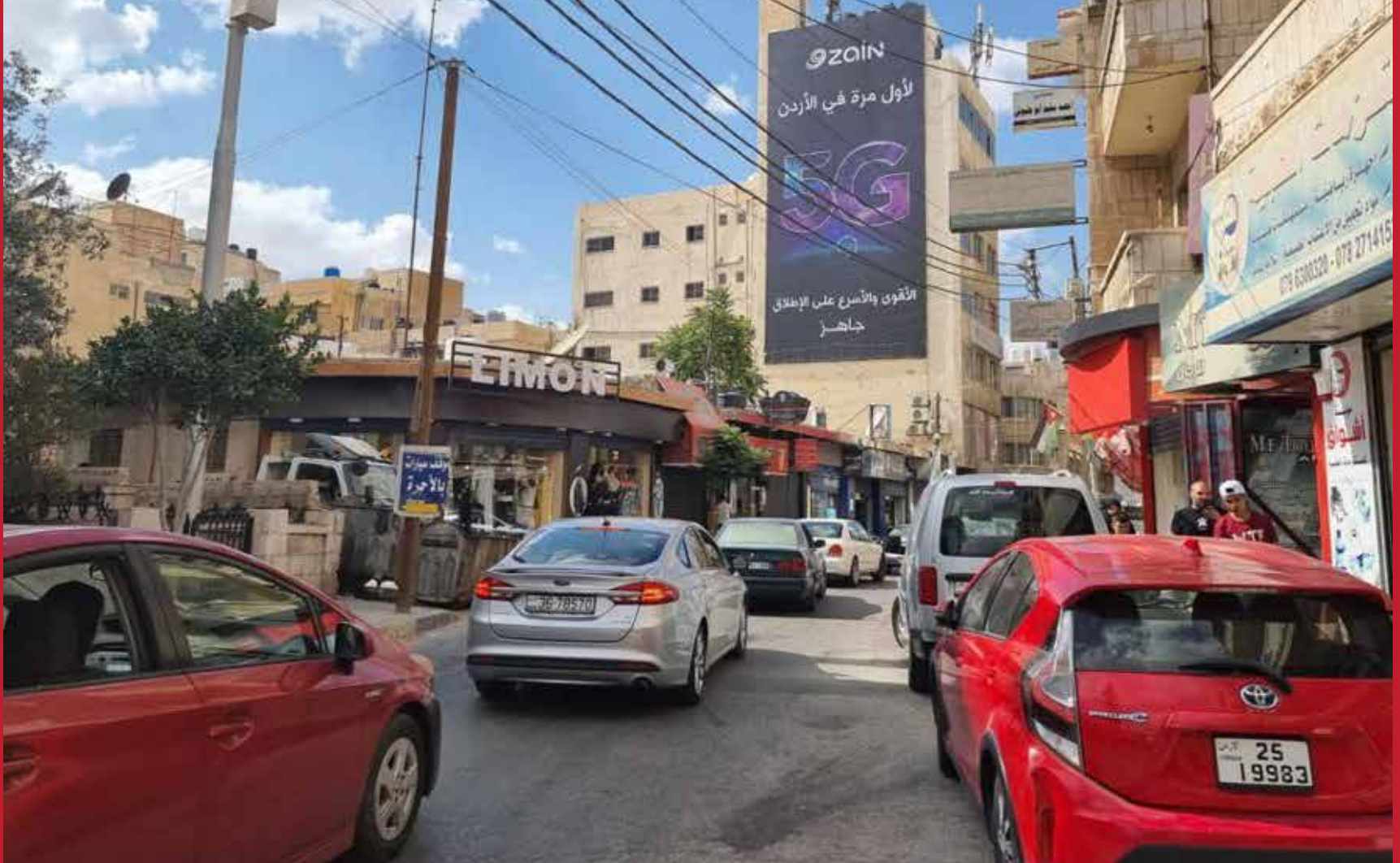
الزرقاء الوسط التجاري عند بلدية الزرقاء و تقاطع شارع الملك عبد الله قياس: عرض 9م , ارتفاع 18م