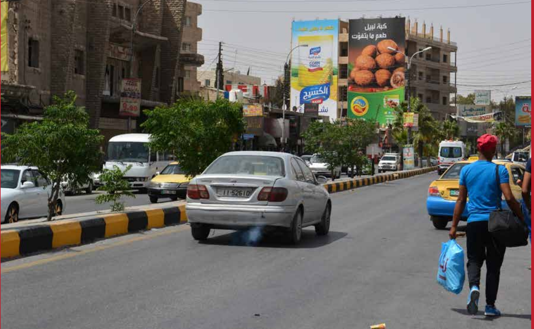
الزرقاء شارع الجيش مقابل الاحوال المدنية و السهل الأخضر قياس: عرض 9م , ارتفاع 18م لكل لوحة