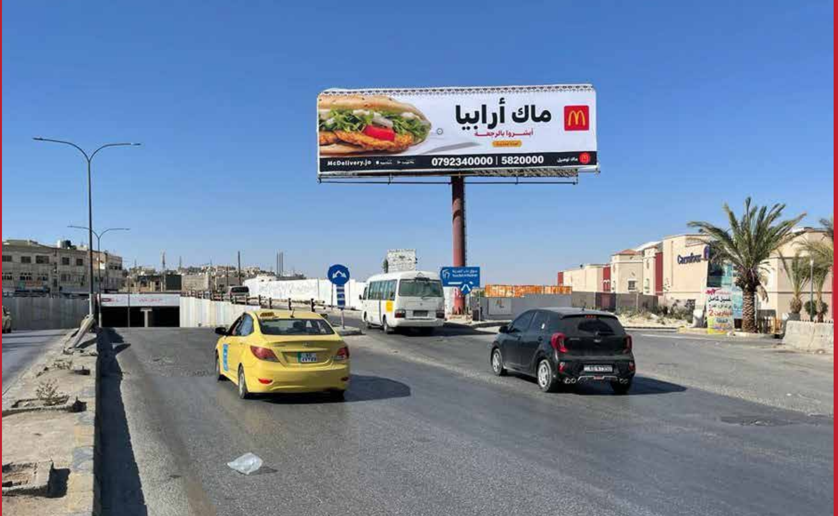
الزرقاء شارع الجيش مدخل مول سوق باب المدينة و كارفور هايبرماركت قياس: عرض 14م , ارتفاع 4م